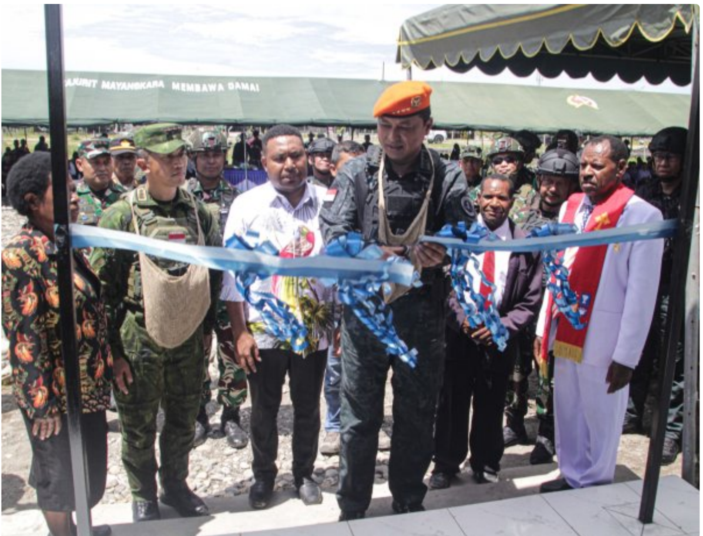
Foto: Kepala Staf Angkatan Udara (Kasau), Marsekal TNI Mohamad Tonny Harjono, S.E., M.M., meresmikan Gereja GPDI Mayangkara pada Rabu (12/02/2025).

NDUGA- Sebuah momen bersejarah terjadi di Kabupaten Nduga, Papua, ketika Kepala Staf Angkatan Udara (Kasau), Marsekal TNI Mohamad Tonny Harjono, S.E., M.M., meresmikan Gereja GPDI Mayangkara pada Rabu (12/02/2025)