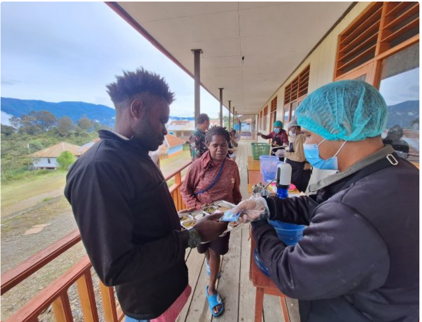
Program Makanan Bergizi Gratis (MBG) yang digagas Satgas Yonif 509 Kostrad bersama Satgas TNI lainnya di Intan Jaya, Papua, Jumat 15 Februari 2025.

INTAN JAYA- Program Makanan Bergizi Gratis (MBG) yang digagas Satgas Yonif 509 Kostrad bersama Satgas TNI lainnya